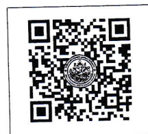
QR-Code เว็บไซต์

โทรศัพท์ ๐-๒๑๐๕-๔๖๘๖ ต่อ ๑๐๐๒๖๖ โทรสาร ๐-๒๔๓๓-๔๙๓๘